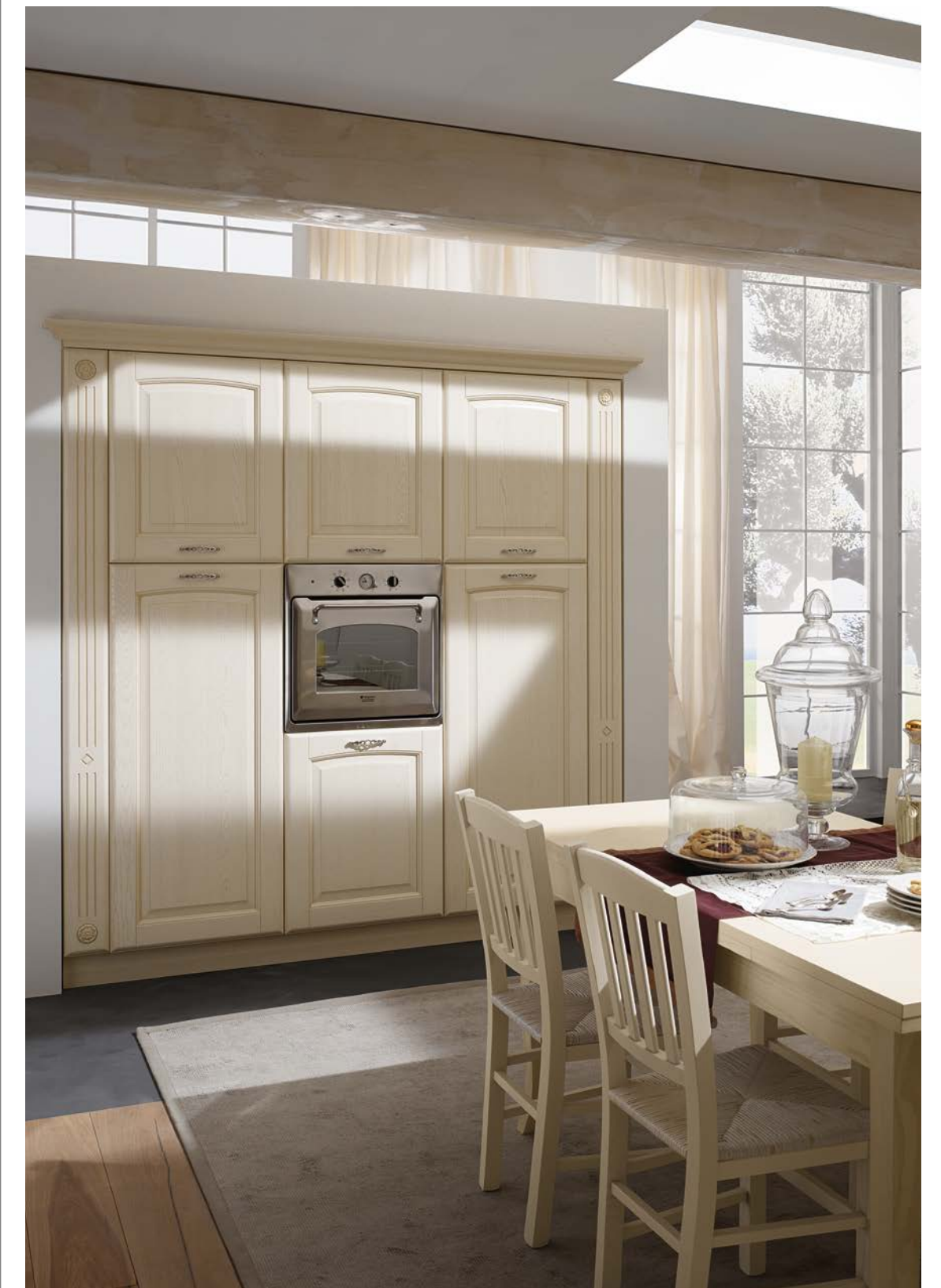
Top in laminato post-forming pietra lavica spessore 4 cm Laminated post-forming worktop in lavic stone colour, 4 cm thickness