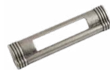
Maniglia Imperial argentata passo 96 mm Silver-plated Imperial handle 96 mm centre distance